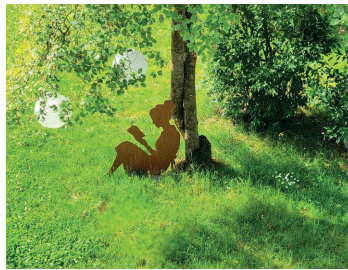
Lesende Frau vor der Bücherei

„Bücher bringen Menschen zusammen und bleiben trotzdem für jeden persönlich.“