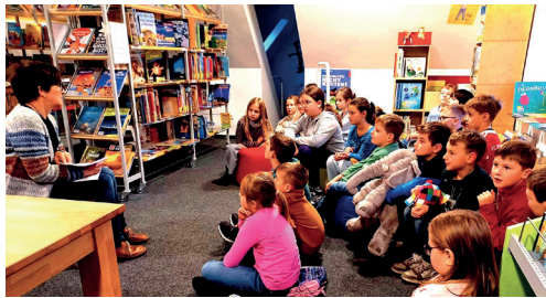
Besuch 3. + 4. Klasse