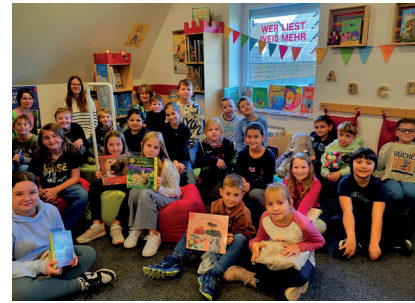
Besuch 3. + 4. Klasse