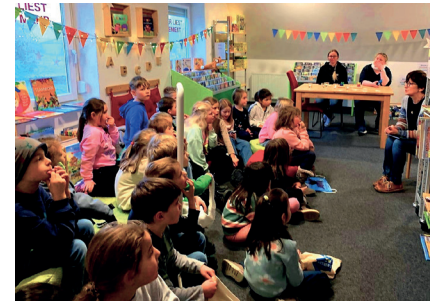
Besuch Kombiklassen - 1. + 2. Klasse