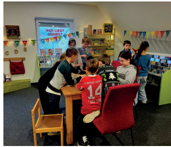
Besuch 3. + 4. Klasse