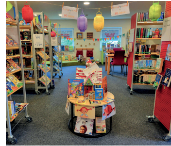
80 Jahre Pippi Langstrumpf

Ein voller Erfolg für einen guten Zweck: Unser Bücherflohmarkt erbrachte einen Erlös von stolzen 400,60 Euro. Ein herzliches Dankeschön an alle Spender und Käufer! Die Summe ist im Januar 2026 direkt in den Kauf neuer Medien geflossen.