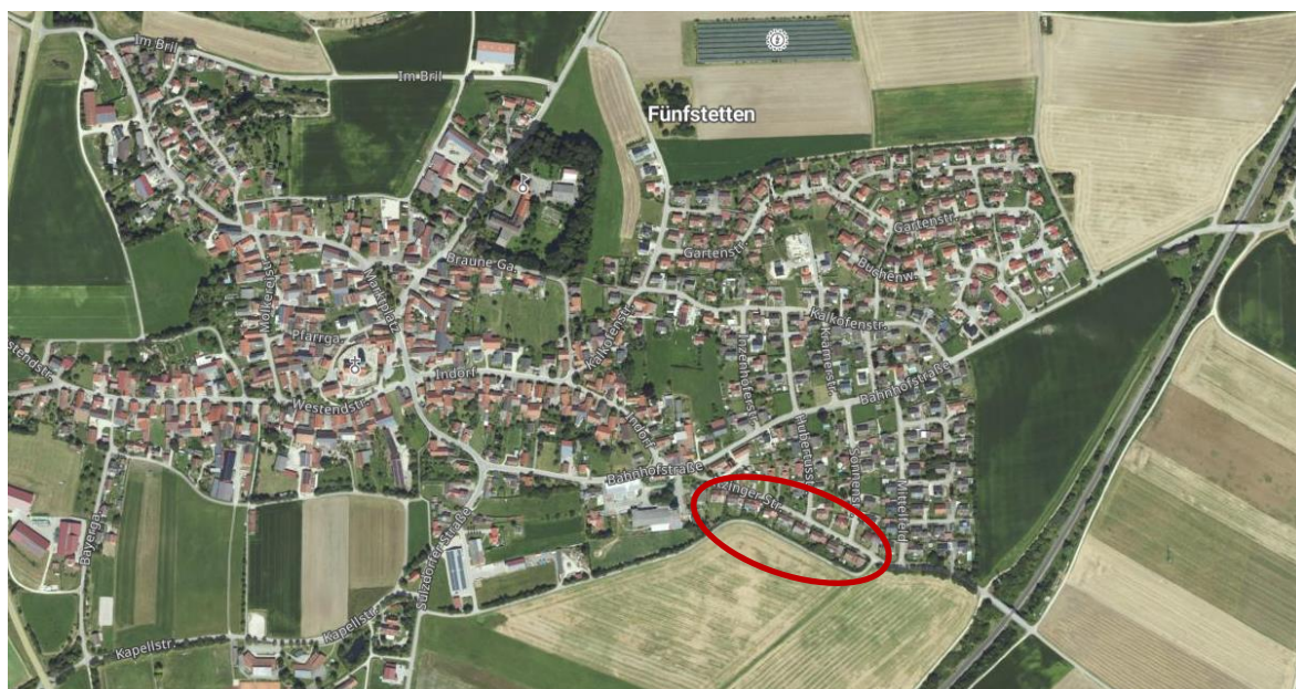
Abb. 1: Lage im Raum, ohne Maßstab

Das Planungsgebiet liegt im Südosten von Fünfstetten. Das Planungsgebiet umfasst die Wohnsiedlung südlich der Itzingerstraße.